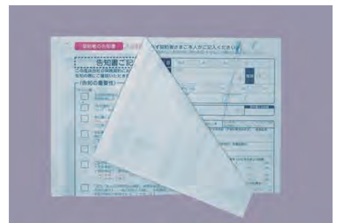
カーボン紙・ノーカーボン紙