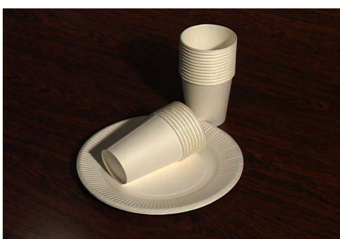
防水加工された紙(紙コップ等)