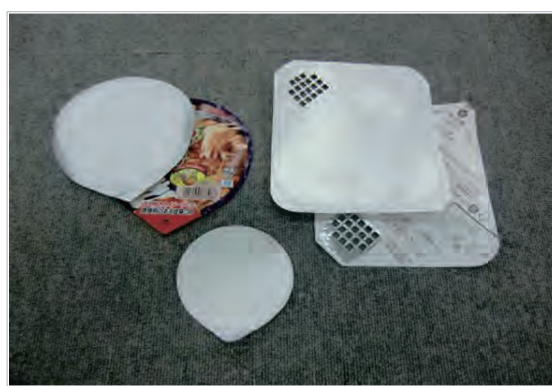
アルミ箔の紙(カップ麺のふた等)