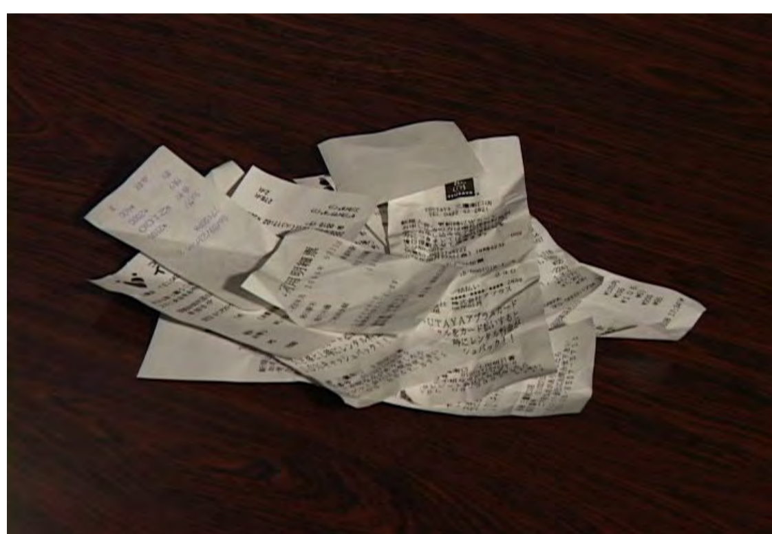
感熱紙(レシート等)