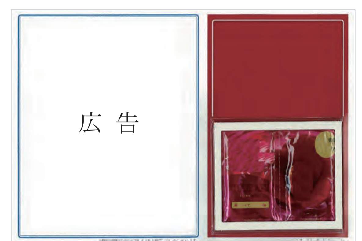
折込チラシ等に付随した試供品