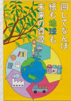
ポスター部門 中学3年生