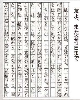
作文部門 小学5年生