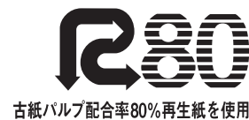
古紙パルプ配合率80%再生紙を使用