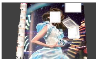
（香水試供品付の雑誌）