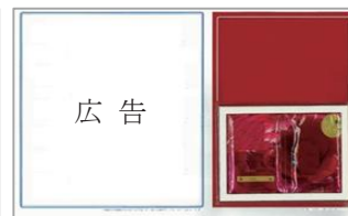
（シャンプー・香水など）