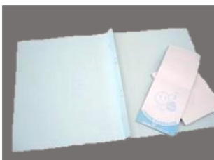
メモ用紙・紙製ファイル