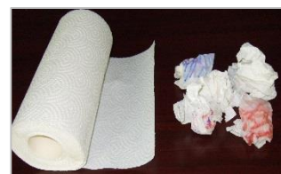
（使用済みペーパータオル）