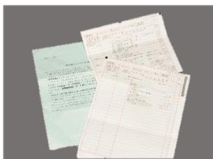
ダイレクトメール