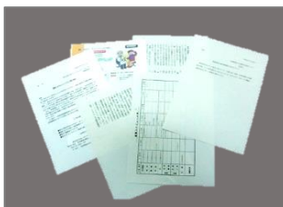
使用済みのコピー用紙