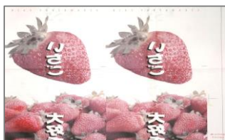
（使用済み昇華転写紙）